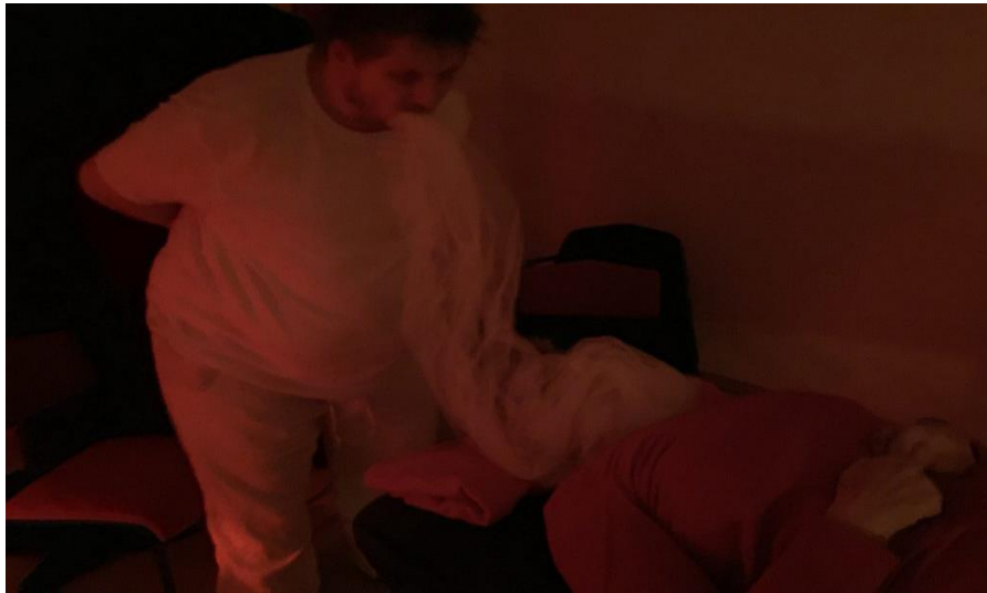
Behandlung mit Ektoplasma