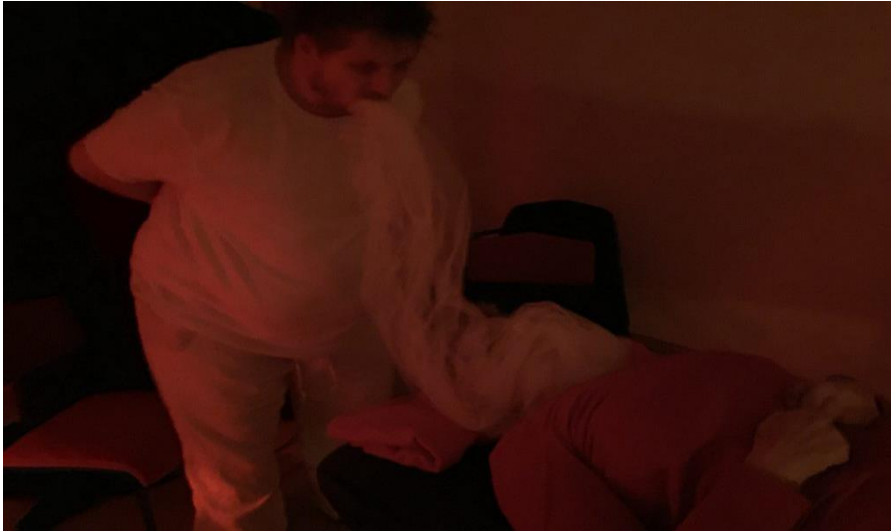
Behandlung mit Ektoplasma