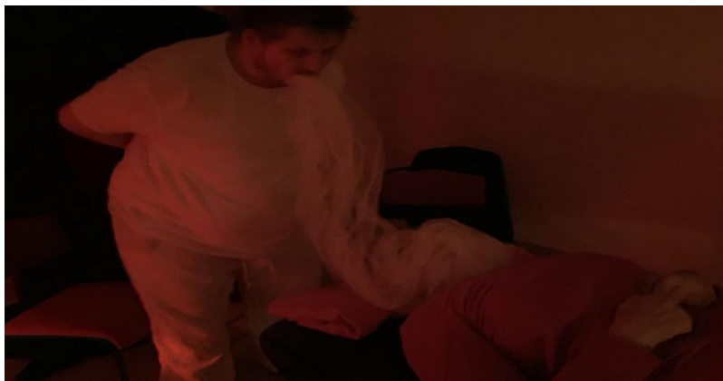
Behandlung mit Ektoplasma